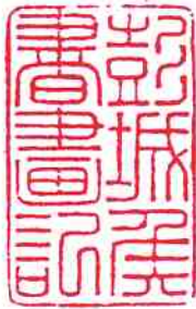
彭城侯書画記 『古今公私印記』より