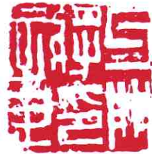
牙門将印章