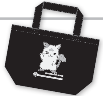
（ねこ松ランチバッグ選べる2色【白・黒】）