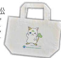
(ねこ松ランチバッグ)