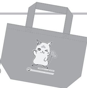
（ねこ松ランチバッグ【カーキ】）