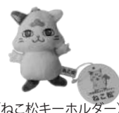
（ねこ松キーホルダー）

スタンプを2つ集めると、本学オリジナルグッズ ねこ松ランチバッグもしくは、 ねこ松キーホルダーをプレゼント！