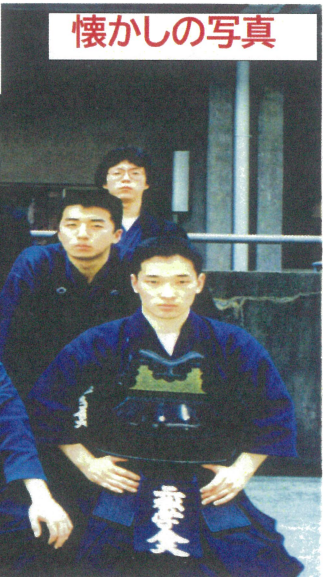
第32回 関東学生剣道新人戦大会 昭和61年6月8日 青山学院大学記念館