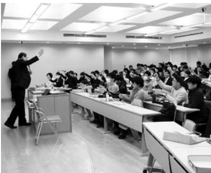
高野副学長も駆けつけた出陣式