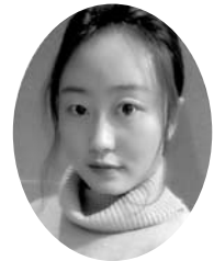
中国 周口師範学院

留学とは他の国に勉強するだけに限らず、その国で様々なところへ冒險して、やったことないことを試すことができます。私は「いつも好奇心を持たなければ」と思っています。今回の留学は、シェアハウスに住んでいます。日本人はもちろん、世界各地の国の人はここで共同生活をして、たくさんパーティーをしたり、自国の料理を作ってみんな一緒にシェアしたりします。違う国の人々と一緒に住んだり、カラオケへ行ったり、料理を作ったり、台湾で普通の大学生活を過ごしていたら、絶対に経験できないことばかりです。とても貴重です。日本の文化だけでなく、いろいろな国の文化に触れることができます。視野が広がり、考え方も変わります。他の国で生活のは誰でも頼らずに一人で解決しないとけません。最初は辛かったです。でも、達成するとこの苦労は価値があります。留学の期間のうち自分に磨いて、自分を成長させることができる良い機会だと思います。 学生時代のうちに、留学したほうがいいです。なぜなら、社会に出る前に、もう一度自分の人生を考え直すことができます。学生時代はいっぱい間違えをしても、すぐやり直せば大丈夫です。その失敗の経験のおかげで、人生がより良いものになるかもしれません。