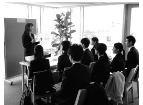
創縁会 (学内合同企業説明会)